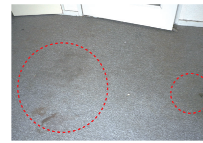
飲み物等をこぼしたことによるカーペットのシミ 手入れ不足等で生じたもの⇒ 借主負担