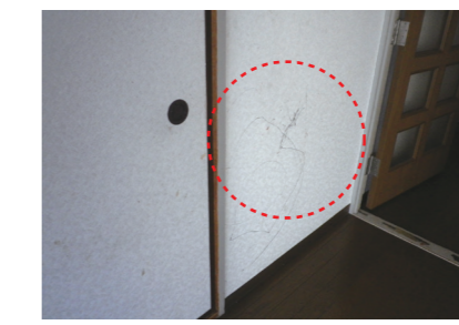
壁への落書き等の故意による毀損⇒ 借主負担