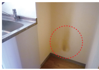
冷蔵庫の後部壁面の黒ずみ(電気ヤケ) 通常の使用による損耗⇒ 貸主負担