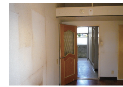
壁のタバコ等のヤニ 通常の使用による損耗を超える⇒ 借主負担