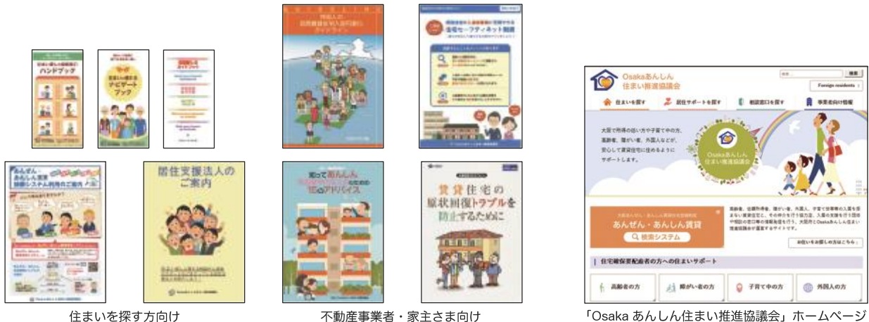
住まいを探す方向け

居住支援に関する制度を紹介するパンフレットの他、協議会のホームページを通じて様々な情報を提供しています。