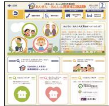
「あんぜん・あんしん賃貸検索システム」

詳しくは、パソコン、スマートフォンで http://sumai.osaka-anshin.com/ あんぜん・あんしん賃貸 検索